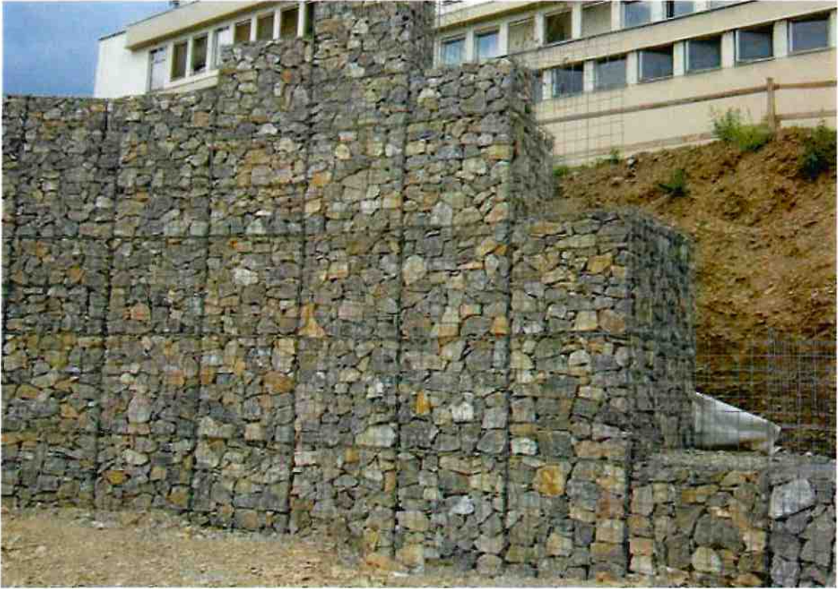
1. Zid de sprijin din gabioane