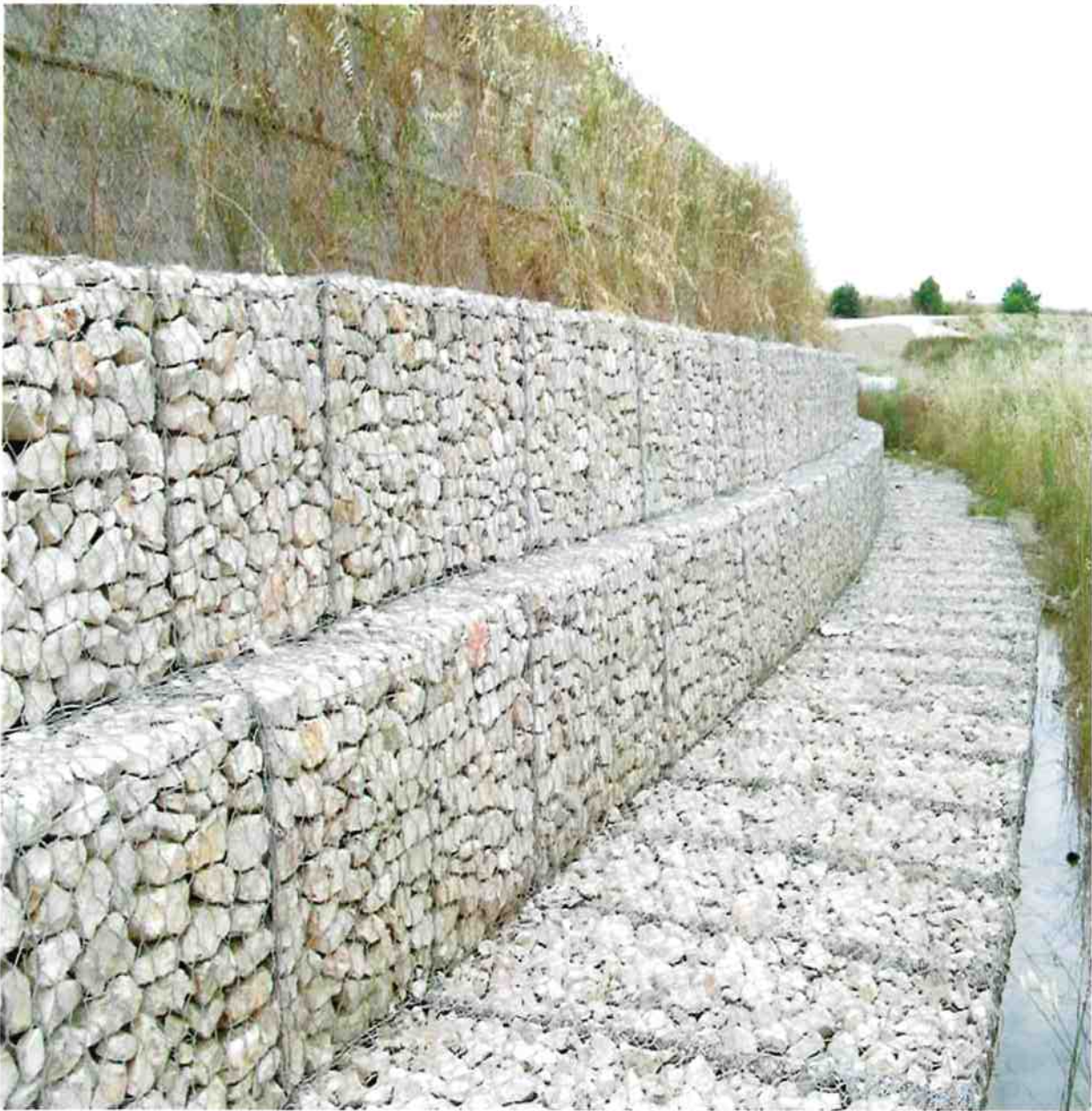
2.Gabioane folosite la sprijiniri de maluri